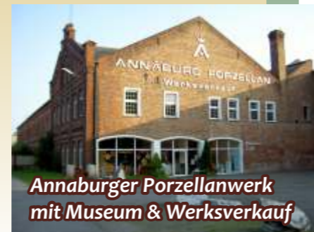
Annaburger Porzellanwerk mit Museum & Werksverkauf