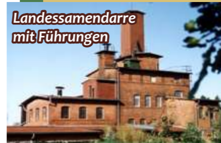
Landessamendarre mit Führungen