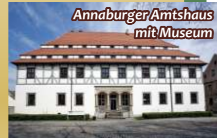
Annaburger Amtshaus mit Museum